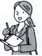
取材 / 上岡稀生子

いつ何時、起きるかわからない大震災に備えましょう 第2回「夜間避難所開設訓練」を実施致します。